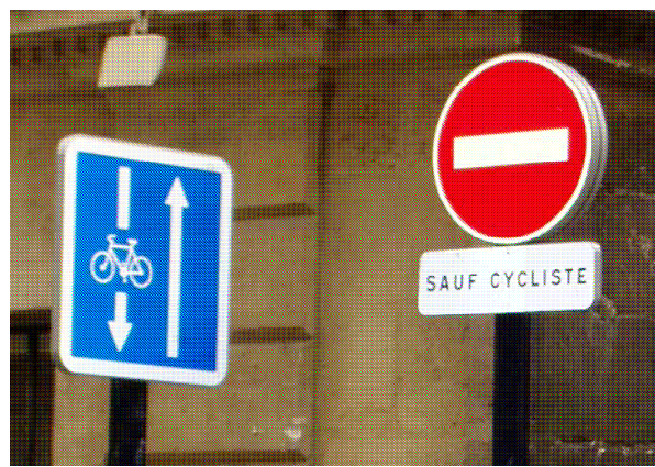
PANNEAUX DOUBLE-SENS CYCLABLE

Pour nous aider à généraliser cette politique sur toute l'agglomération, soutenez notre démarche et rejoignez EDEN !